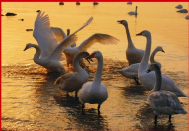
湖浪飞歌