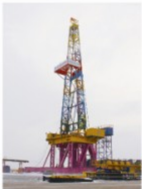
“地壳一号”万米钻机完成吊装

号”万米科学钻机出厂启运仪式进行了现场直播之后，新华社、人民网、中央电视台、《光明日报》《科技日报》《国土资源报》、吉林电视台、长春电视台、吉林人民广播电台、《吉林日报》《长春日报》《东亚经贸新闻》《新文化报》等多家媒体、中国日报网、新浪、搜狐、网易、腾讯等门户网站及四川、黑龙江多家当地媒体对“地壳一号”启运及远程运输都进行了相关报道或转载，此外，中央电视台科教频道(CCTV10)《走近科学》栏目组将运用高空航拍等先进拍摄手段对运输过程进行纪录报道。