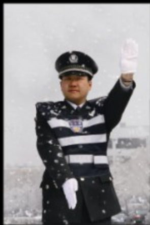
雪中执勤