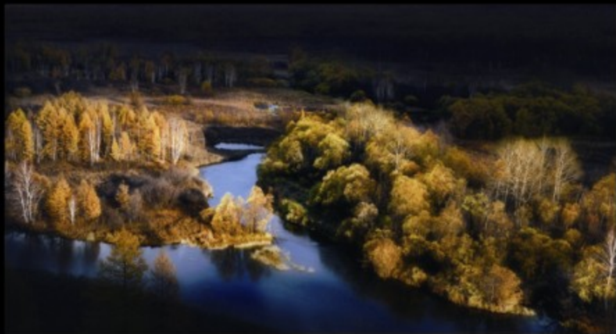
伊图里河