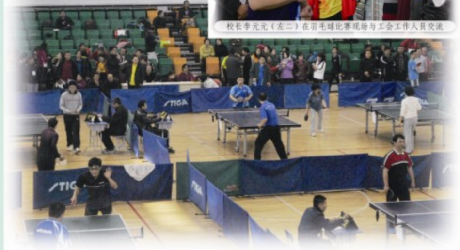
第13届“乒协杯”教职工乒乓球赛如火如荼