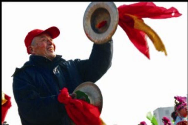
欢庆 / 董春福摄