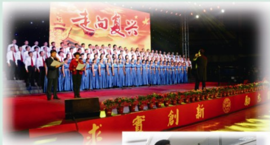
“唱响古大 放飞梦想”主题合唱比赛现场歌声响彻夜空