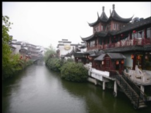
烟雨楼台