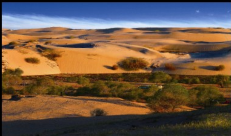
层峦引高节