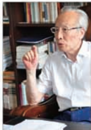
31 问渠那得清如许 为有源头活水来