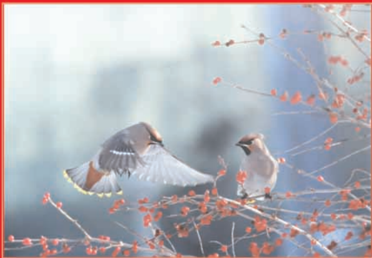
太平鸟喜落吉大阳