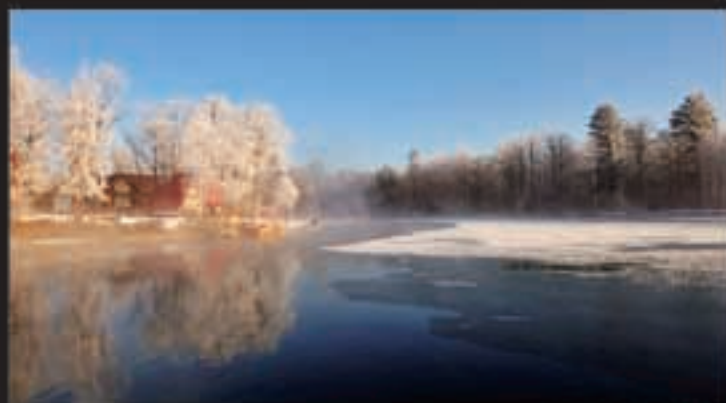
北国童话