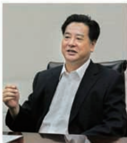
校长李元元接受采访

随着知识领域的拓展,知识结构的细化,“知识板块”的重构和社会需求的凸显,新学科正在不断增加。大学作为一个知识交融之所,人才集中之地,催生新学科不单是一种任务,实际上也是各种知识体系相互作用的必然结果。催生的新学科越多,一定程度上证明知识领域拓展地广,知识结构细化越深,知识板块碰撞重构能力越强,越能满足社会需求,这是一个大学有活力的表现。从这个方面来讲,当然是新生学科越多越好。但是学科成长有它的自身规律,必须有自己的理论体系和开