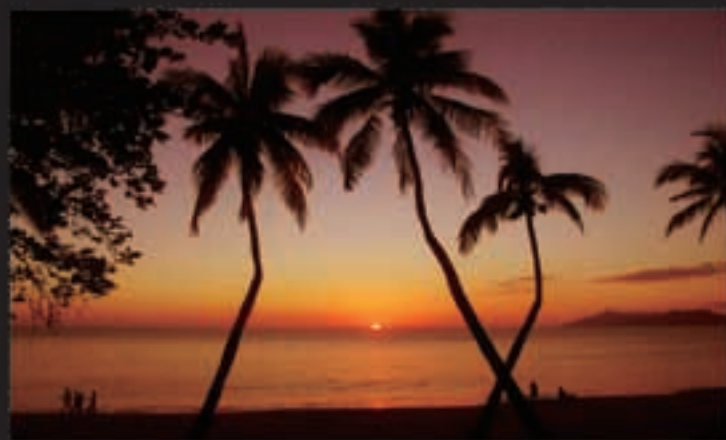
椰林暮色